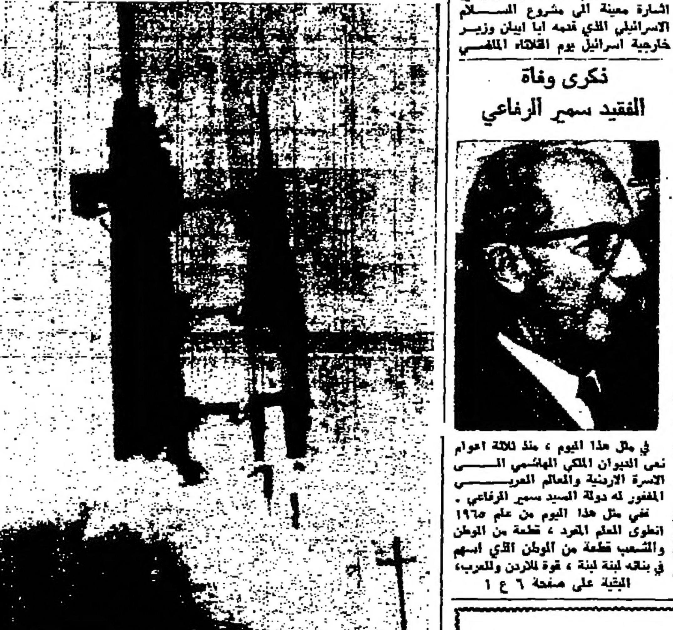
فروع ستهين لدى انطلاقه الى القضاة امس وهو يحمل السرواد الأمريكيين القلعة - صورة اخبري الرواد على الصفحة السابعة (التصوير اليوناني تيريس خاصة بالمشور)

مول فرق إسرائيل لاتفاق هدنة الأمم المتحدة - رويتر - قال الأردن ان أعمال الفرق الأخيرة لتفان الهدنة العادلة من جانب إسرائيل يجعل مصاصي السلام الإسرائيلية الأخيرة عنصرية العنصرية. وقال الدكتور محمد القرا بنحوب الأردن لدى الأمم المتحدة دون ان يشير الاشارة معينة الى مشروع السلام الإسرائيلي الذي تقدمه أبا ايبان وزير خارجية إسرائيل يوم الثلاثاء الماضي. تكرى وفاة الفقيه سهر الرفاعي